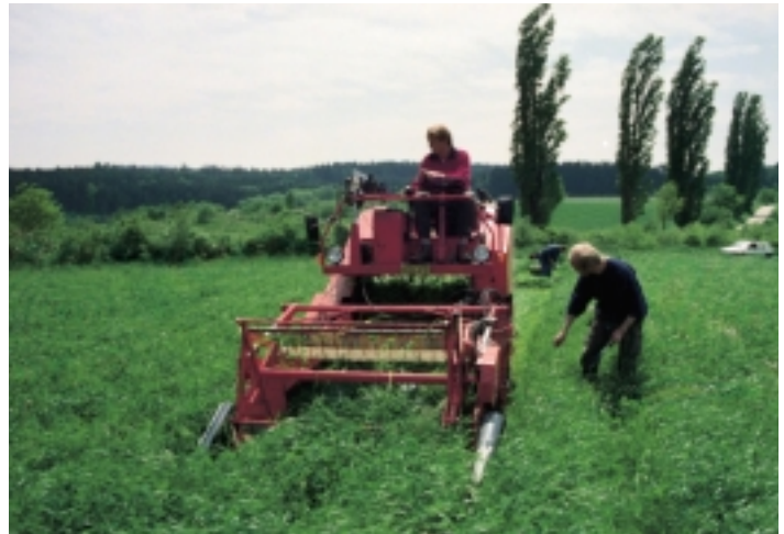
Klee-Gras-Mahd im ökologischen Betrieb

TU München - Wissenschaftszentrum Weihenstephan, Freising; GSF - Forschungszentrum für Umwelt und Gesundheit GmbH, Neuherberg.