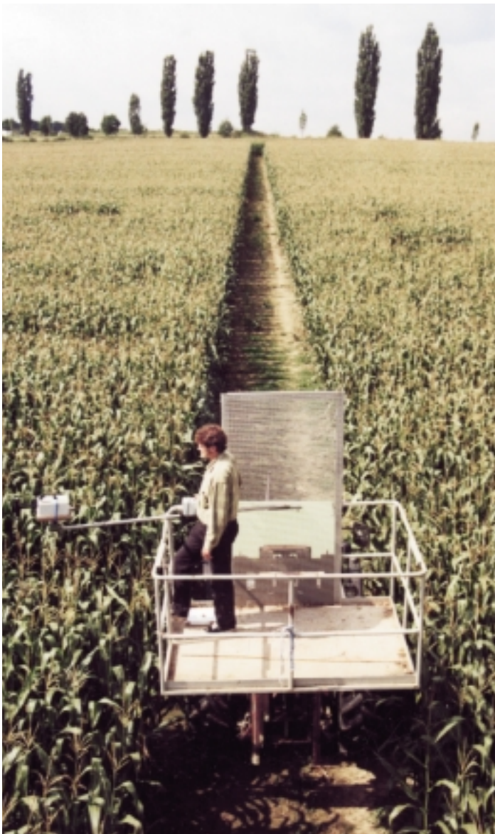
Erfassung des aktuellen Pflanzenzustands zur ortsgenauen Düngerdosierung

D er Forschungsverbund Agrarökosysteme München (FAM) entwickelt Konzepte für eine nachhaltige Landnutzung. Die Landwirtschaft muss die Menschen heute und in Zukunft ernähren, die Kulturlandschaft erhalten, die Umwelt schonen und dabei wirtschaftlich sein. Um Landschaften optimal nutzen zu