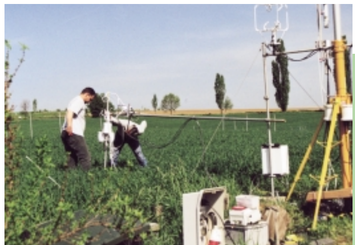
Erfassung der Bestandstranspiration