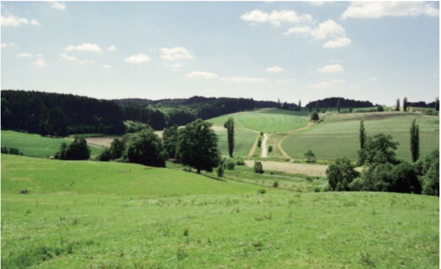
Nachhaltige Landwirtschaft in einer vielfältigen Landschaft