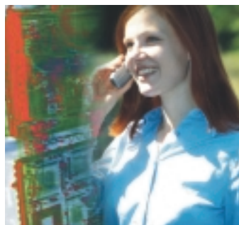
ABB Flexible Automation GmbH, ALLOD GmbH & Co. KG, Bratke Kunststofftechnik GmbH, Coherent (Deutschland) GmbH, Dr. Hielscher GmbH, feinfocus Röntgen-Systeme GmbH, Finisar Europe GmbH, Horst Scholz GmbH & Co. KG, Knotenpunkt, Laserquipment AG, Lifocolor Farben GmbH & Co. KG, Loctite Research, Development & Engineering Group, Martin GmbH, PicoRapid Technologie GmbH, Robert Bosch GmbH, Siemens AG, Siemens Dematic AG, Simotec GmbH, TETRA GmbH, Thermosensorik GmbH, Volume Graphics GmbH, W. C. Heraeus GmbH & Co. KG