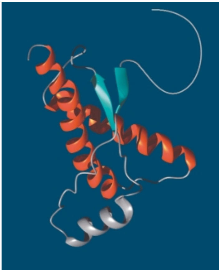
PrPC ist die zelluläre Form des Prionproteins.