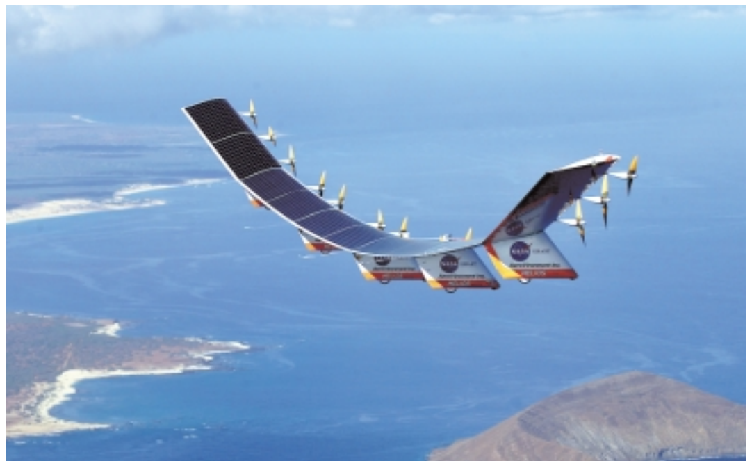
Solarzellen und eine Tragfläche aus Faserverbundwerkstoffen in Ultraleichtbauweise ermöglichen eine Flughöhe von 23 km des Helios-Solarflugzeuges.

Materialwissen online: http://www.format.mwn.de