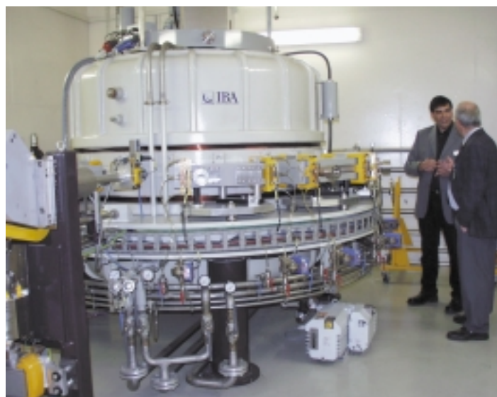
Der Elektronenstrahlbeschleuniger in Saal a. D. verfügt über 10 MeV Beschleunigungsenergie und 150 MW Strahlleistung.

FORMAT hat die Trägerschaft für das Projekt „Elektronenbehandlung von Werkstoffen“ übernommen, das der Freistaat Bayern aus Mitteln der High-Tech-Offensive finanziert. Unter Betreuung von FORMAT führen acht bayerische Universitäten und Fachhochschulen an einem der leistungsfähigsten Elektronenbeschleuniger der Welt in Saal a. D. ihre Versuche durch. Dabei sollen die Vorteile der Elektronenbestrahlung insbesondere für die Vernetzung von Kunststoffen erforscht werden.