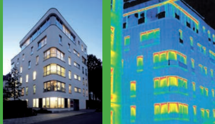
Einsatz von VIP zur Wärmedämmung an Außenwänden