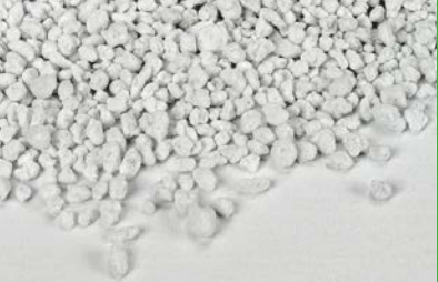
Perlit als Füllmaterial der Vakuumdämmplatten