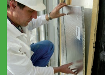
Montage der Platten