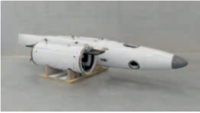
Hier ist CFK bereits im Einsatz: Instrumententräger und vollständiger Unterflügelbehälter für das Forschungsflugzeug HALO, entwickelt und hergestellt von der Fa. Aerostruktur