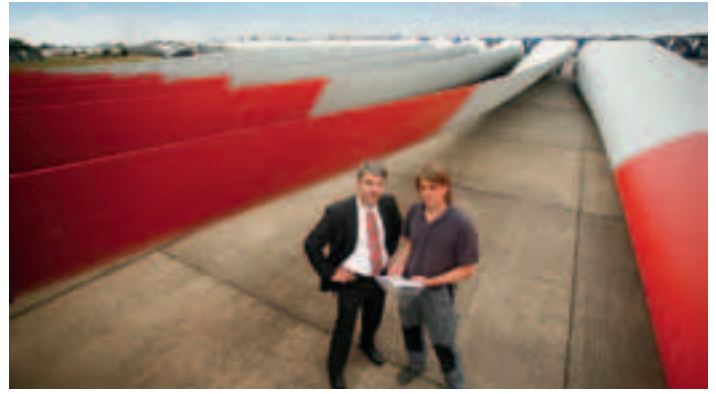
Frischer Wind für Verbundwerkstoffe: Die Fa. SGL Rotec verwendet CFK für Rotorblätter in Windkraftanlagen