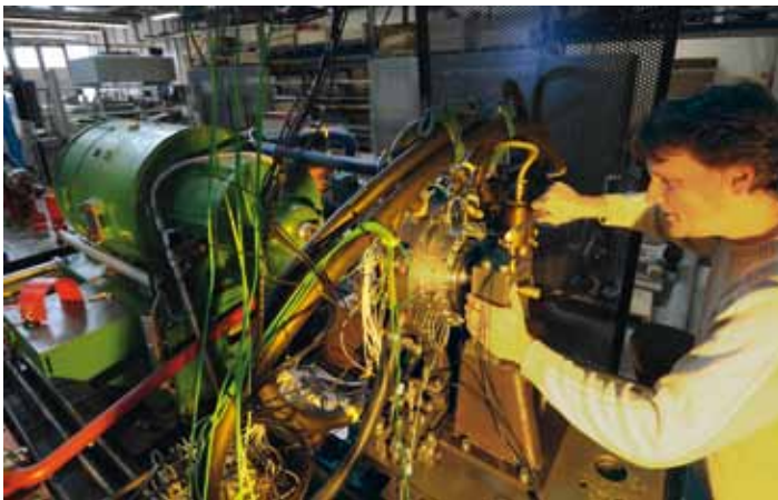
Versuchsanlage zur experimentellen Bestimmung rotodynamischer Eigenschaften von Dampfturbinen