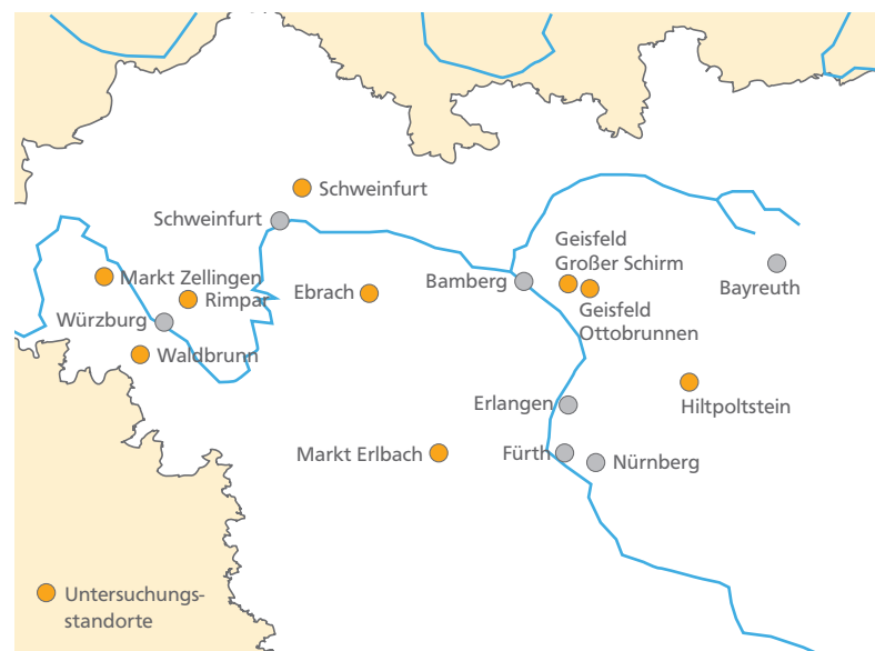
Abbildung 1: Lage der Untersuchungsflächen in Nordbayern

Weiter werden die Häufigkeit und die Intensität klimatischer Extremereignisse ansteigen. Dazu zählen Stürme und Starkregenereignisse ebenso wie Trockenperioden im Sommer (Christensen et al. 2007; Rennenberg et al. 2004; Suttmöller et al. 2008). In Zentraleuropa werden zukünftig vermehrt Sommerdürren auftreten, wodurch die Wälder zunehmend häufigerem Trockenstress während der Vegetationsperiode ausgesetzt sein werden (Christensen et al. 2007; Suttmöller et al. 2008). Für Wälder spielt auch der Bodenwassergehalt eine entscheidende Rolle, denn die erwarteten Temperatur- und Niederschlagsregime werden diesen (und damit die Wasserverfügbarkeit für die Bäume) maßgeblich beeinflussen. Modellen zufolge wird die Kombination von höheren Temperaturen und abnehmenden Sommerniederschlägen zu einem Rückgang des Bodenwassergehalts von mehr als 50 Prozent führen (gemittelt über Süddeutschland) (Rennenberg et al. 2004). Auch Kölling und Falk (2010) schätzen, dass sich im Zuge des Klimawandels der Anteil der günstigen Wasserhaushaltsstufen in Bayern von über 70 Prozent (2000) auf unter 40 Prozent (2100) verringern wird. Gleichzeitig wird der Anteil der als trocken eingestuft Standorte von vier Prozent (2000) auf 28 Prozent (2100) erheblich ansteigen (Szenario B1, WETTREG-Regionalisierung).